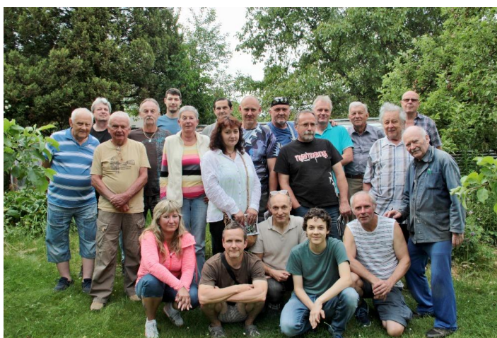
Část členské základny SPKS Sokolov, z.s.